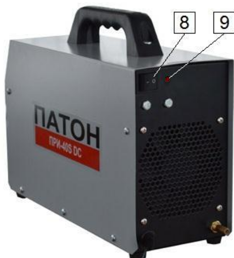
Рис.1. Элементы управления и индикация