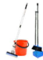
Швабры, веники, совки, щетки