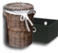
Корзины, коробки и ящики для вещей