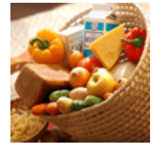
Корзины для кухни