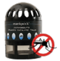
Ловушки и отпугиватели