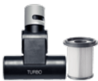
Аксессуары к пылесосам, парочистителям, полотерам