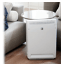
Воздухоочистители (мойки воздуха)