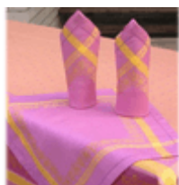
Скатерти и салфетки