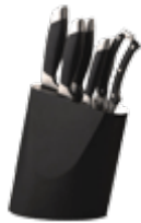
Наборы кухонных ножей