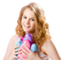
Шампуни, кондиционеры и бальзамы