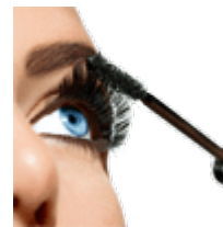
Тушь для ресниц