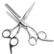
Ножницы для стрижки волос