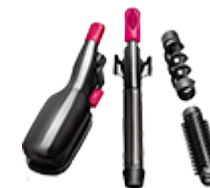
Аксессуары к фенам, щипцам для волос