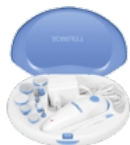
Электрические приборы для маникюра и педикюра