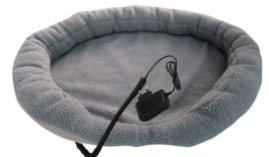
HEATED ANIMAL DEN CR 7431