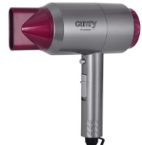
HAIR DRYER CR 2256