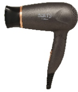
HAIR DRYER CR 2261