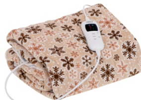
HEATING UNDERBLANKET CR 7430