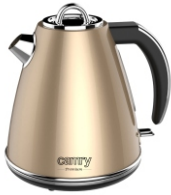
ELECTRIC KETTLE CR 1292