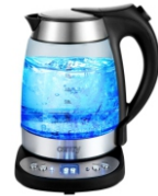
ELECTRIC GRILL CR 3044