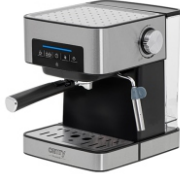
ESPRESSO MACHINE CR 4410