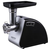
MEAT MINCER CR 4812