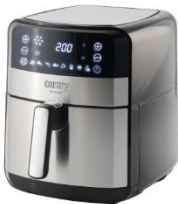
AIR FRYER OVEN CR 6311