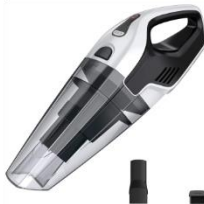
BAGLESS VACUUM CLEANER CR 7046