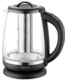
ELECTRIC KETTLE CR 1290