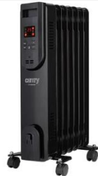
OIL FILLED RADIATOR CR 7812