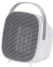
CERAMIC FAN HEATER CR 7732