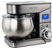
FOOD PROCESSOR CR 4223