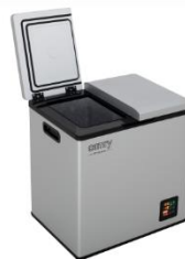
PORTABLE FRIDGE CR 8076