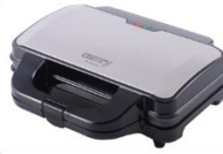
SANDWICH MAKER CR 3054