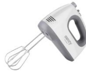
MIXER CR 4220