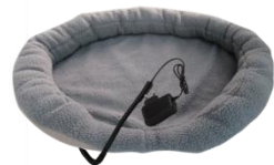
HEATED ANIMAL DEN CR 7431