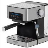
ESPRESSO MACHINE CR 4410