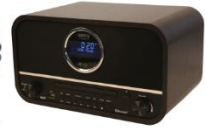
RETRO RADIO CR 1182