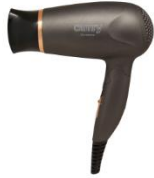
HAIR DRYER CR 2261