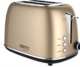
TOASTER 2 SLICES CR 3217