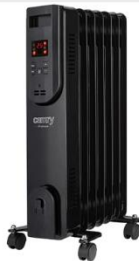
OIL FILLED RADIATOR CR 7812