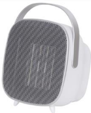
CERAMIC FAN HEATER CR 7732