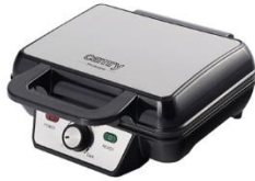
WAFFLE MAKER CR 3046