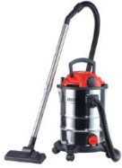
VACUUM CLEANER CR 7045