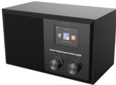
INTERNET RADIO CR 1180