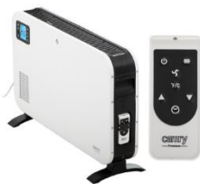
CONVECTION HEATER CR 7724