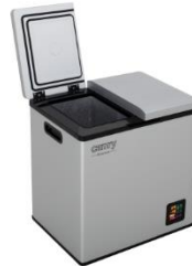
PORTABLE FRIDGE CR 8076