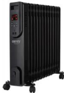
OIL FILLED RADIATOR CR 7814