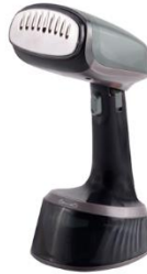
GARMENT STEAMER CR 5033