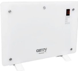
GLASS HEATER CR 7721