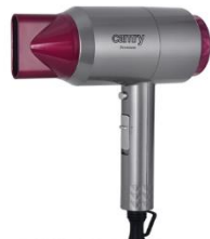
HAIR DRYER CR 2256