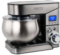
FOOD PROCESSOR CR 4223