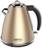
ELECTRIC KETTLE CR 1292