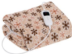
HEATING UNDERBLANKET CR 7430