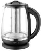
ELECTRIC KETTLE CR 1290