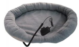
HEATED ANIMAL DEN CR 7431