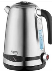
ELECTRIC KETTLE CR 1291