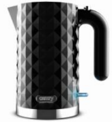
Electric Kettle CR 1169