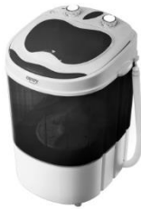
WASHING MACHINE CR 8054