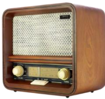
RETRO RADIO CR 1188