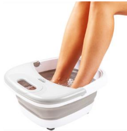
FOOT SPA CR 2174