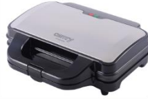
SANDWICH MAKER CR 3054