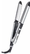
HAIR STRAIGHTENER CR 2320