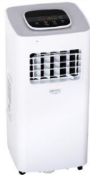
AIR CONDITIONER CR 7926