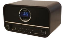
RETRO RADIO CR 1182