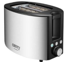
TOASTER 2 SLICES CR 3215