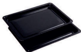
1 Противень 1 шт (у модели GN50ARC - 2 шт)