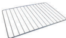
2 Решетка гриль 1 шт