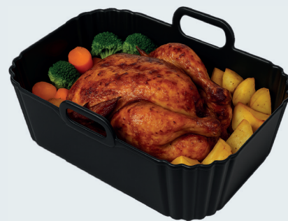
Wkład silikonowy do frytkownicy Silicone insert for air fryers