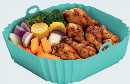
Wkład silikonowy do frytkownicy Silicone insert for air fryers