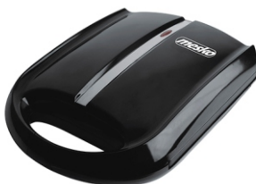
NUT MAKER MS 3041