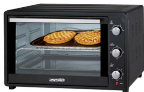
ELECTRIC OVEN MS 6021