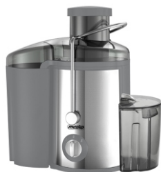
JUICE EXTRACTOR MS 4126