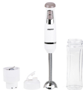
HAND BLENDER MS 4624