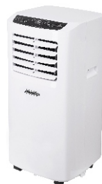
AIR CONDITIONER MS 7911