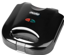
SANDWICH MAKER MS 3032