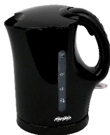
ELECTRIC KETTLE MS 1284