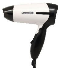
HAIR DRYER MS 2262