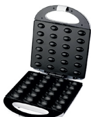
Nut Cookie Maker AD 3039