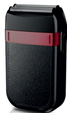
Hair Shaver AD 2932