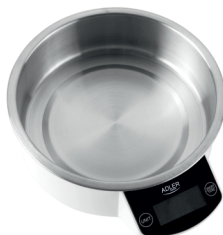
Kitchen Scale AD 8121