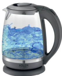
Kettle AD 1286