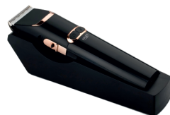
Hair Clipper AD 2832