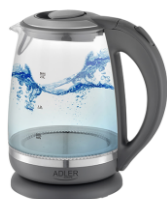
ELECTRIC KETTLE AD 1286