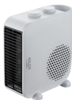
FAN HEATER AD 7725