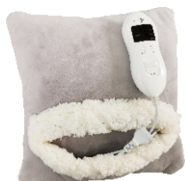
HEATED PAD AD 7412