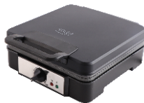
WAFFLE MAKER AD 3049