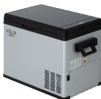
PORTABLE FRIDGE AD 8077