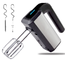
MIXER AD 4225