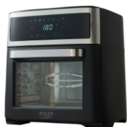
AIR FRYER OVEN AD 6309