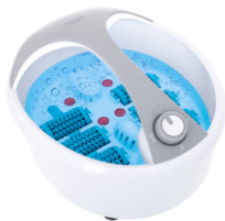
FOOT SPA AD 2177