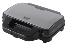
SANDWICH MAKER AD 3043