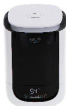
AIR HUMIDIFIER AD 7966