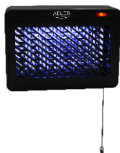
MOSQUITO LAMP AD 7938