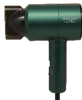
HAIR DRYER AD 2265