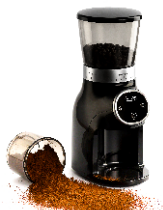
Burr Coffee Grinder AD 4450