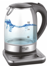
ELECTRIC KETTLE AD 1293