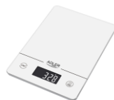
KITCHEN SCALE AD 3170