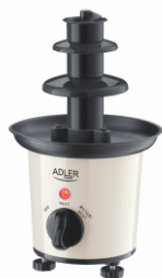
CHOCOLATE FOUNTAIN AD 4487