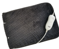
HEATED PAD AD 7433