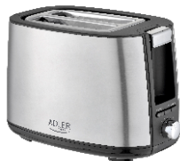
TOASTER 2 SLICE AD 3214