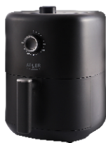
AIR FRYER AD 6310