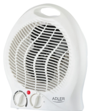
FAN HEATER AD 7728