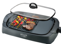
ELECTRIC GRILL AD 6610