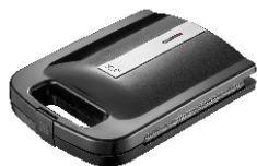
Sandwich Maker AD 3055