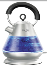
Electric Kettle AD 1282