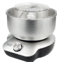
MIXER WITH BOWL AD 4222