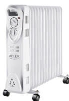
OIL-FILLER RADIATOR AD 7811