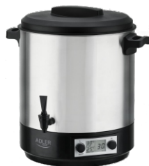
PASTEURIZATION POT AD 4496