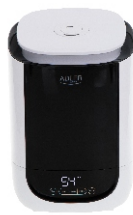
AIR HUMIDIFIER AD 7966