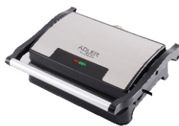
ELECTRIC GRILL AD 3052