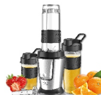
PERSONAL BLENDER AD 4081