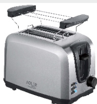
TOASTER 2 SLICE AD 3222