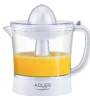
CITRUS JUICER AD 4009