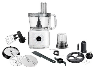
FOOD PROCESSOR AD 4224