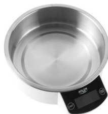
KITCHEN SCALE AD 3166