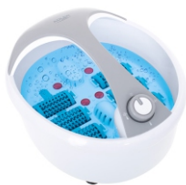
FOOT SPA AD 2177