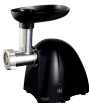
MEAT MINCER AD 4811