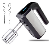
MIXER AD 4225